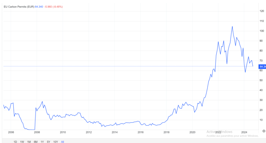
Figure 3 : Le prix du droit à émettre une tonne de carbone dans l'EU ETS